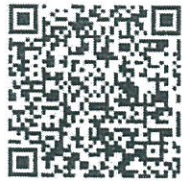
QR Code แบบสำรวจ